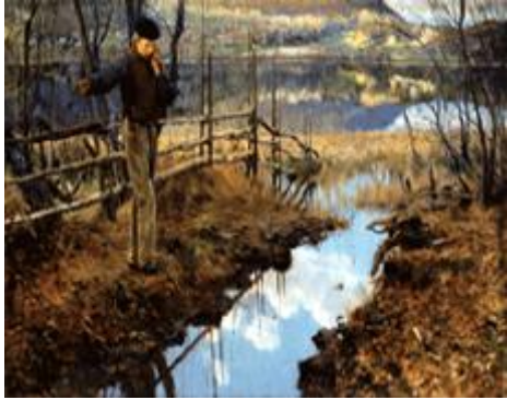
1886: Christian Skredsvigs berømte maleri