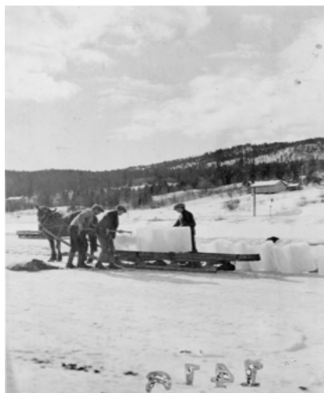
Isskjæring på Bondivann - 1925.