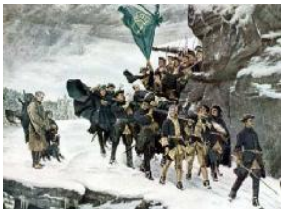
Foto: Karl 12's død - Felttog i Norge 1716-1718.